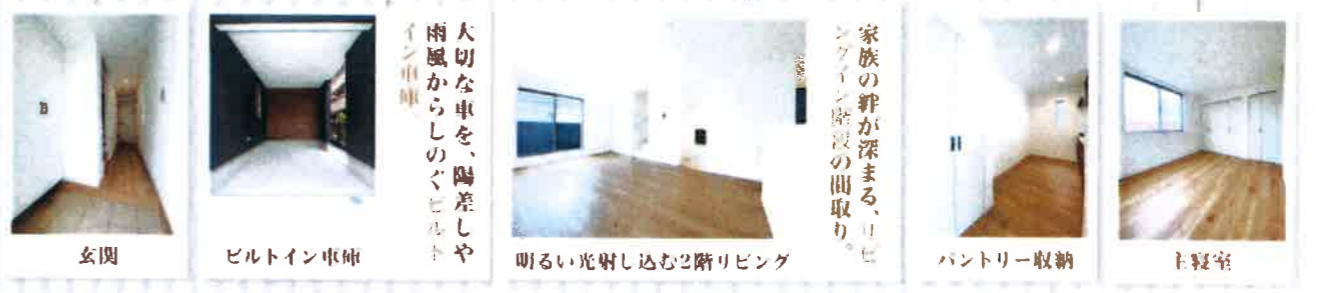
玄関 ビルトイン車庫 明るい光射し込む2階リビング パントリー収納 主寝室