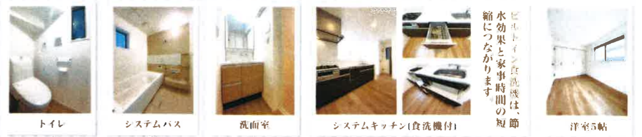
トイレ システムバス 洗面室 システムキッチン(食洗機付) 洋室5帖